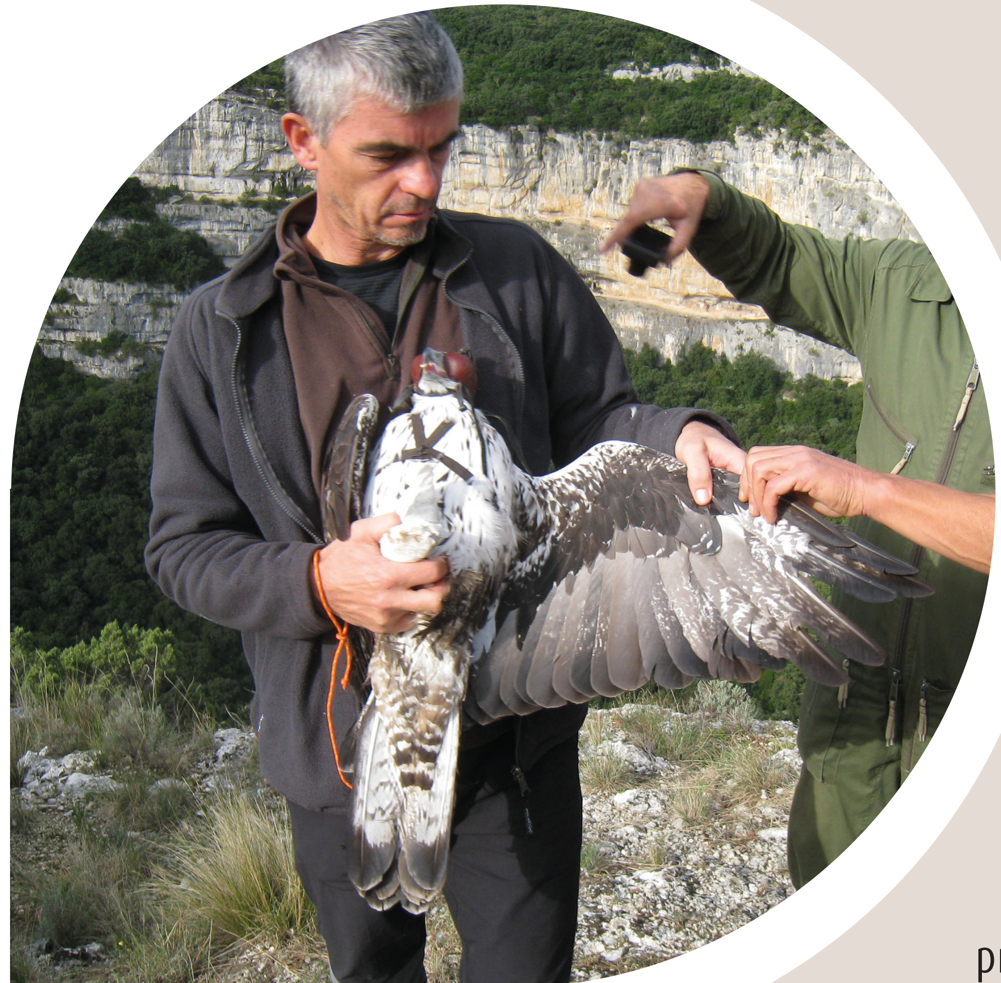
Pose d'une balise GPS sur un aigle en Ardèche

La synergie des programmes Aigle de Bonelli (LPO) et Natura 2000 (SGGA) a permis la mise en place d'une politique territoriale partagée par divers acteurs. La préservation des sites de reproduction, assurée par un suivi coordonné (LPO/SGGA), est une priorité. Il doit être complété par le suivi des sites vacants pour appréhender le retour de l'espèce. Les conventions du SGGA avec les pratiquants de sports de nature (CDFME et CDS) et le programme de gestion des espèces proies mené par les chasseurs, le SGGA et la LPO doivent se poursuivre.