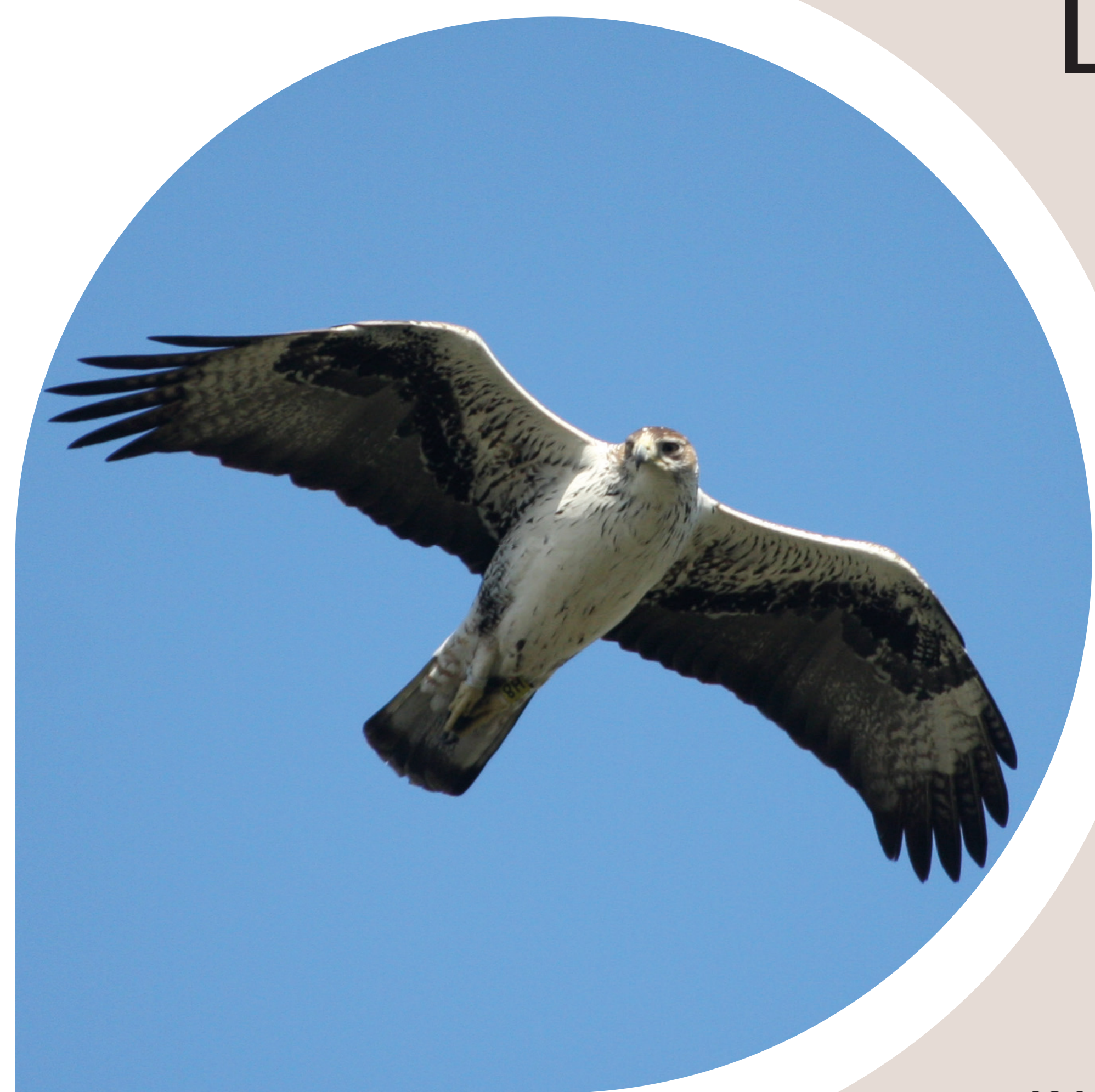
L'aigle de Bonelli - un super prédateur du biome méditerranéen !

L'Aigle de Bonelli est présent depuis plus de 200 000 ans dans le sud de la France. Proche de la disparition au début des années 2000, il n'a jamais été réintroduit de protection qui ont permis d'atteindre 34 couples en 2017... La mobilisation doit se poursuivre !