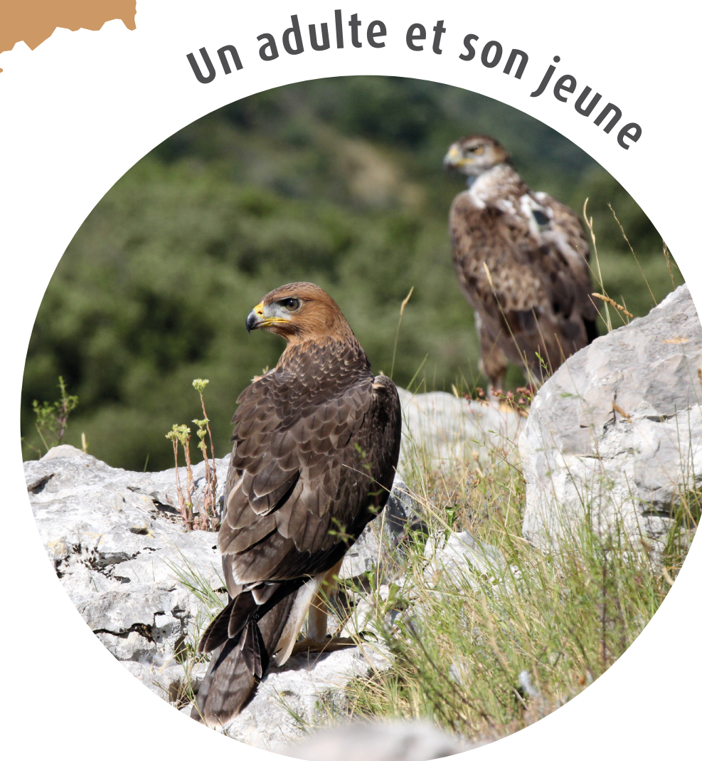
Les actions menées en faveur des 2 couples de l'Ardèche participent au maintien de la population nationale.

Les populations en fort déclin depuis la 2nde moitié du 20 e siècle, sont aujourd'hui stabilisées autour d'une trentaine de couples en Languedoc-Roussillon, PACA et Rhône-Alpes.