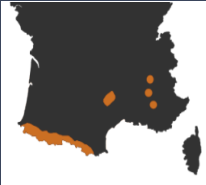
Répartition des couples de Vautour fauve en France. LPO—Grands Causses

Aujourd'hui, la population compte plus de 2500 couples répartis sur différents massifs.