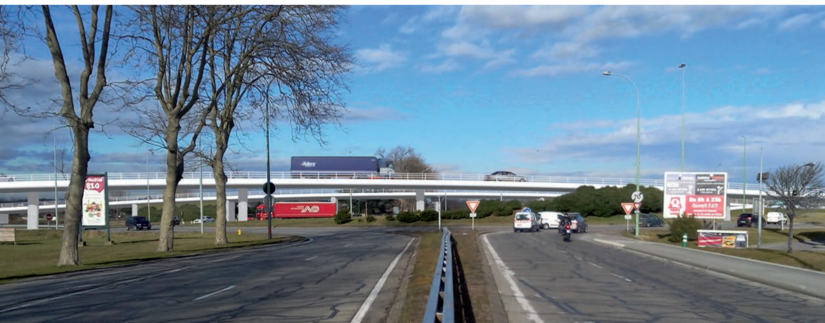
Vue depuis l'avenue de Romans

Le pont très long permet de garder des ouvertures