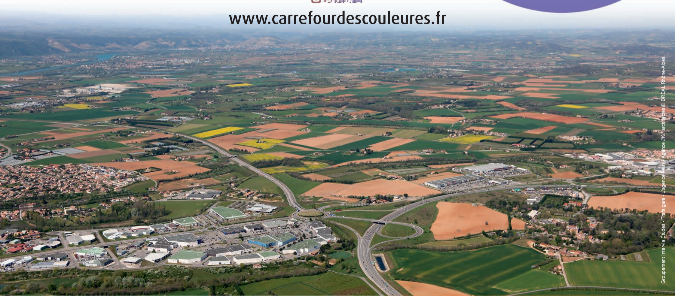
Vue aérienne du plateau des Couleures