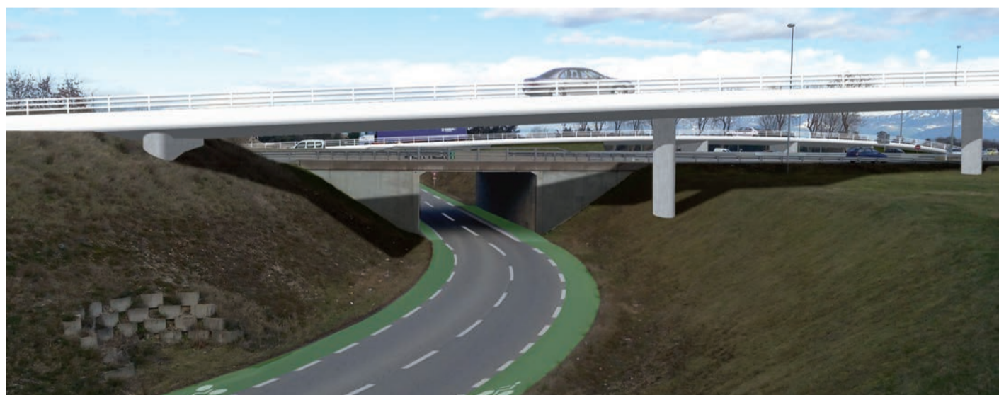
Vue sur le chemin du Chantre (avec bandes cyclables)

Le projet présente également l'opportunité de réorganiser la traversée cyclable de ce secteur, actuellement très contrainte