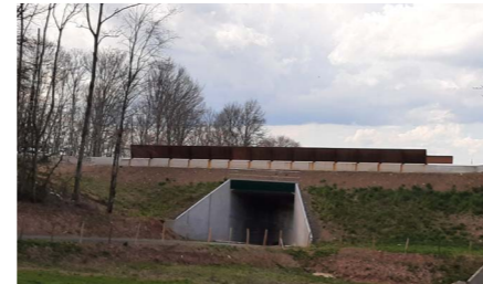
Passage grande faune dans la forêt de Branviel

routier. A cela, s'ajoutent la pose de gîtes chiroptères, la mise en oeuvre de dispositifs de guidage des amphibiens vers les passages aménagés ainsi que des tremplins verts pour l'avifaune et d'un linéaire bocager de près de 4 km. Ces travaux vont démarrer à l'automne.