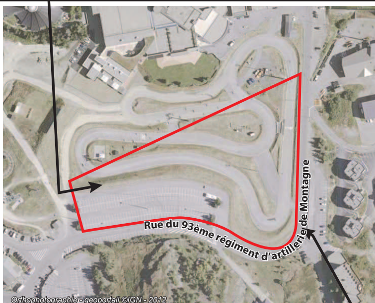
Orthophotographie - geoportail ©IGN - 2012