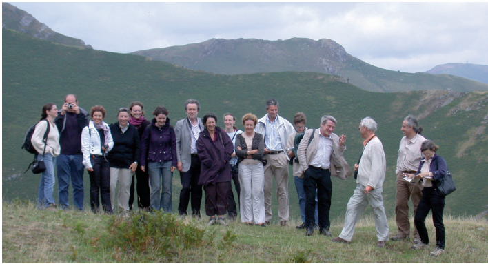
Atelier transfrontalier France-Espagne - 2006