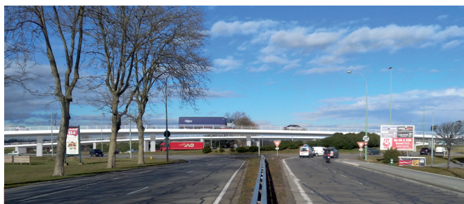
Vue depuis l'avenue de Romans

Le pont très long permet de garder des ouvertures