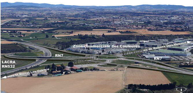
Vue d'ensemble du projet

Le projet d'aménagement prévoit la création de deux ponts permettant la liaison directe des flux de circulation du périphérique (RN7) sans passer par le rond-point des Couleurs.