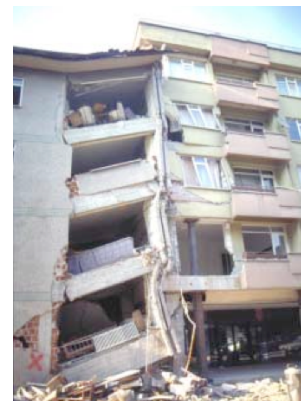
Exemple de dommage dû à l'environnement. chocs entre deux bâtiments adjacents.

Concevoir en capacité. La structure porteuse d'un bâtiment doit toujours être conçue de façon ductile, c'est-à-dire permettant une déformation importante dans ses éléments les plus sollicités par le séisme. La méthode de dimensionnement en capacité offre un procédé simple et efficace, en contrôlant et en localisant les plus grandes déformations aux endroits qui seront les plus renforcés.