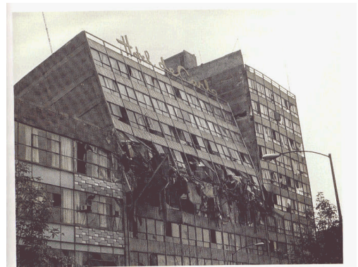
Exemple de dommage dû à l'irrégularité en élévation. Variation des géométries.