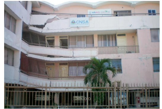
Exemple de dommage dû à l'irrégularité en plan. Structure irrégulière de forme.

Les éléments non porteurs, tels que les remplissages en maçonnerie, les balcons, les parapets, les éléments de façade et les cheminées, doivent également respecter quelques principes élémentaires. Ils doivent être intégrés dans la conception et le dimensionnement de la structure car leur chute peuvent être catastrophique.