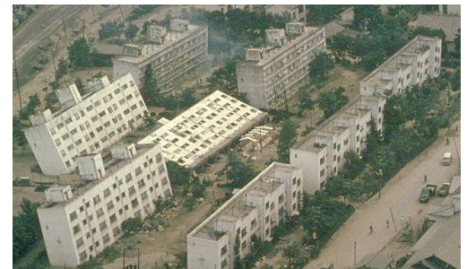
Exemple de dommage dû à l'environnement. Tassement de la structure dû à la liquéfaction