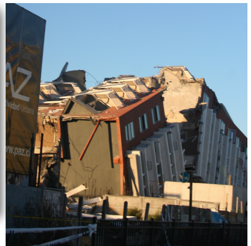
Exemple d'une construction en béton armé endommagée lors du tremblement du Chili (2010). Même en béton armé, un mauvais respect des règles de conception entraîne la destruction complète de la structure.

Niveaux transparents. L'expérience montre que les structures qui possèdent des niveaux transparents (c'est-à-dire sans suffisamment de systèmes de contreventement) sont plus vulnérables et résistent moins aux sollicitations sismiques. De nombreux exemples montrent l'effondrement de la structure provoqué par l'absence de contreventement dans les niveaux transparents. Puisqu'ils sont plus flexibles que les autres niveaux, les poteaux verticaux subissent de grandes déformations latérales et leur rupture provoque l'effondrement du bâtiment. Elle se traduit souvent par l'écrasement du niveau.