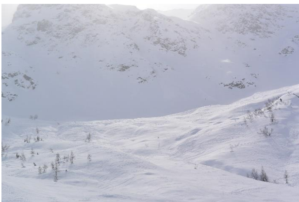
TCC sous la prise d'eau N° 3 (sous l'arête de Montseti)

Sur ces tronçons le risque de prise en gel nous semble donc très faible même avec une réduction du débit, ce qui ne serait pas le cas dans d'autres conditions de morphologie des torrents. Dans la partie aval du Mercuel par exemple (court-circuitée par EDF), le risque est plus marqué car la pente est bien plus forte et il peut y avoir des passages pentus non recouverts de neige.