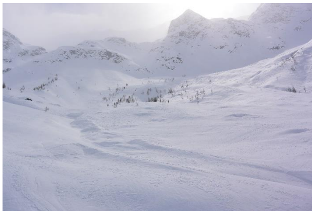
TCC sur le Mercuel sous la prise d'eau N°2 (en haut à gauche : les Chavonnes)