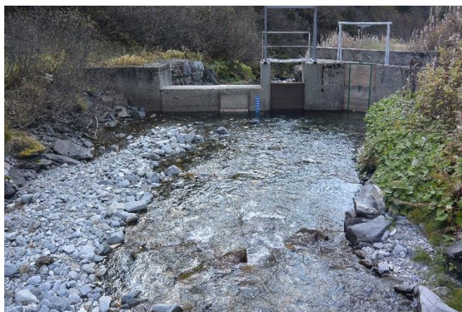
Prise d'eau EDF vue de l'amont (vue rapprochée du site du bâtiment de turbinage projeté)

Par ailleurs il jouxte la prise d'eau existante EDF. L'enjeu local est donc nettement réduit.