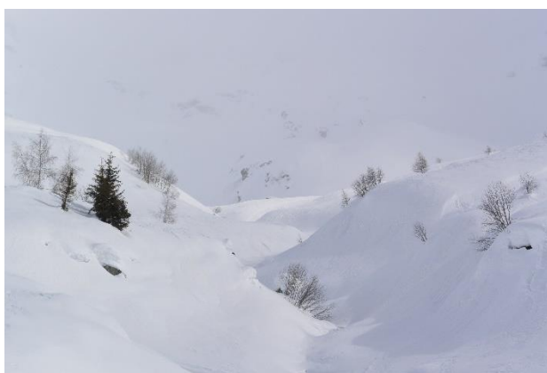
TCC sous la prise d'eau N°1 (ruisseau de Treinant)