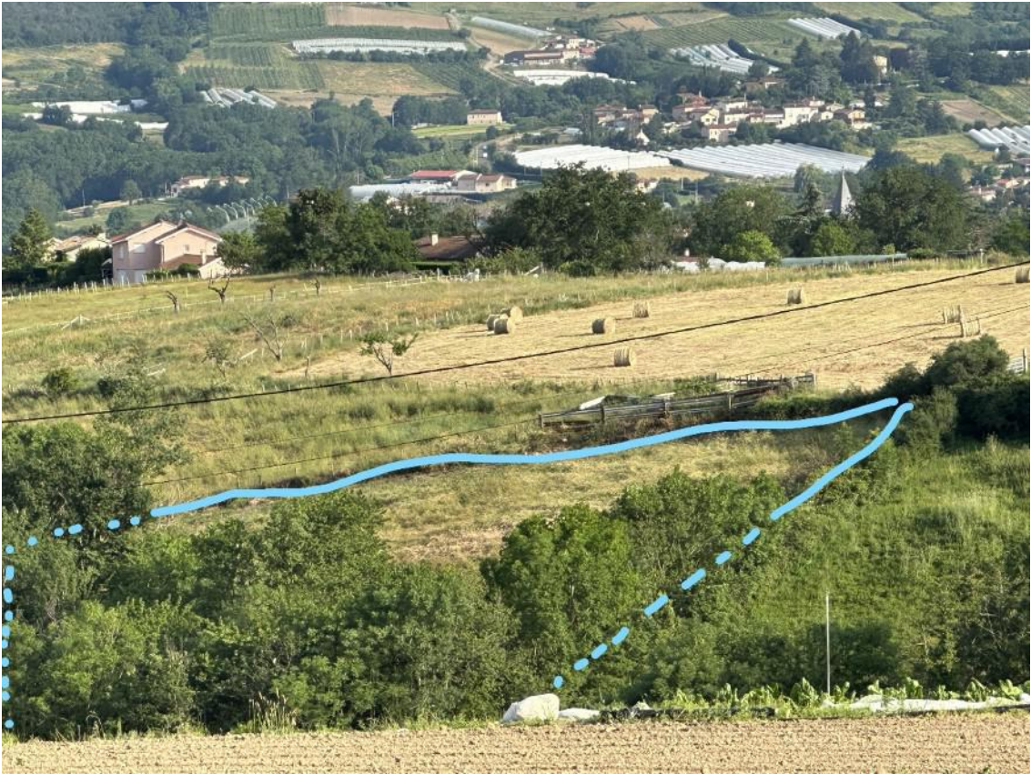
Zone 3 prise du point E