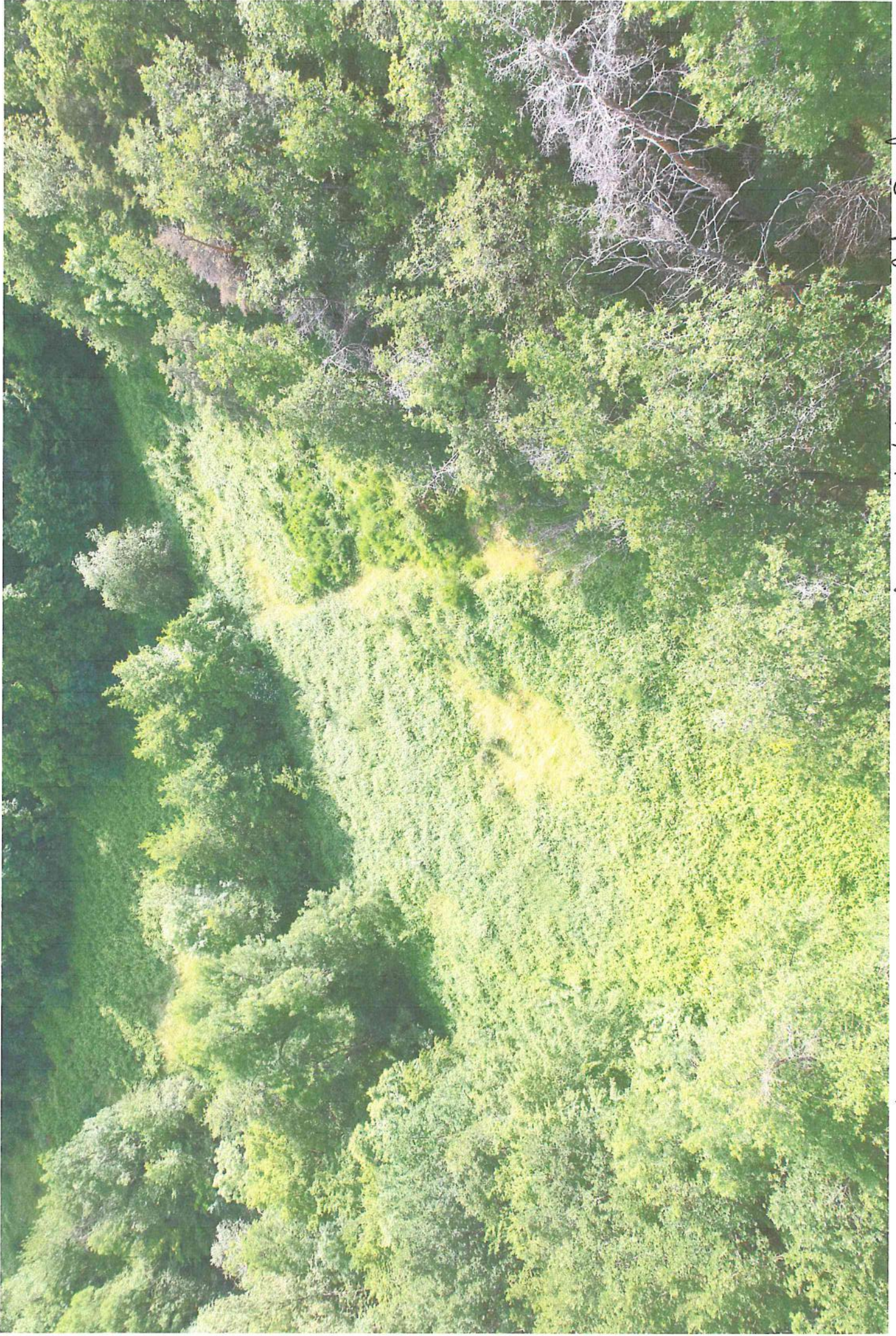
(A) Photo prise au drone le 8 Juin 2013 depuis la pointe Nord du projet = Photo Proche