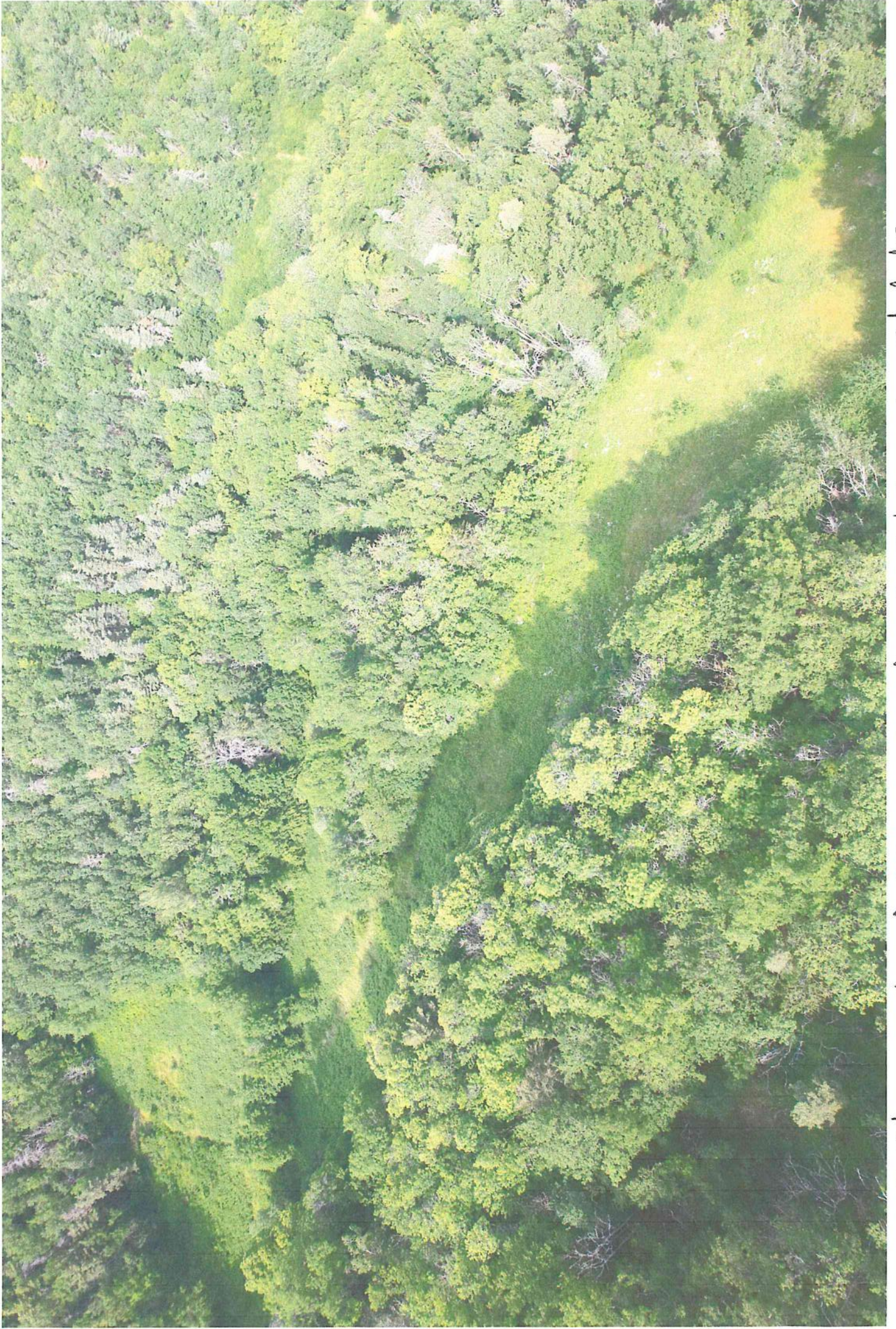
17) Photo prise au chene de 8 Juin 2022 berres la honte Sud du nolet - Photo limboino niver 10012222