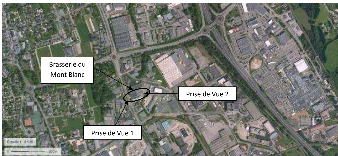
Prise de vue 1 depuis la rue Cassin (façade Ouest) :