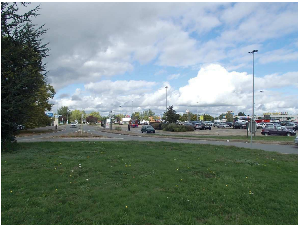
VUE N°8 : SITE DU NOUVEAU BATIMENT INTERSPORT EN VISION LOINTAINE DEPUIS LE GIRATOIRE SUD-OUEST DU CENTRE COMMERCIAL