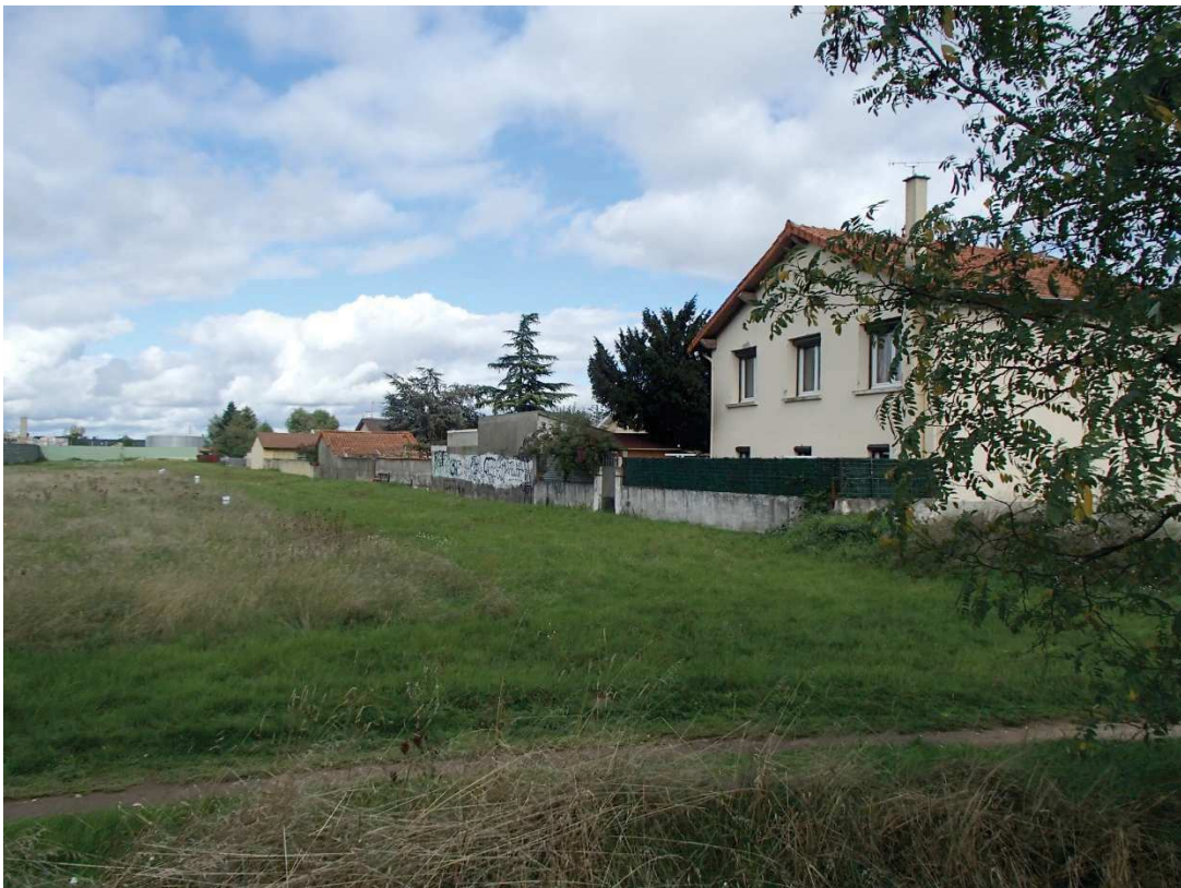
VUE N°2 : HABITATIONS EN BODRURE EST DU SITE DU PARKING POUR LE PERSONNEL