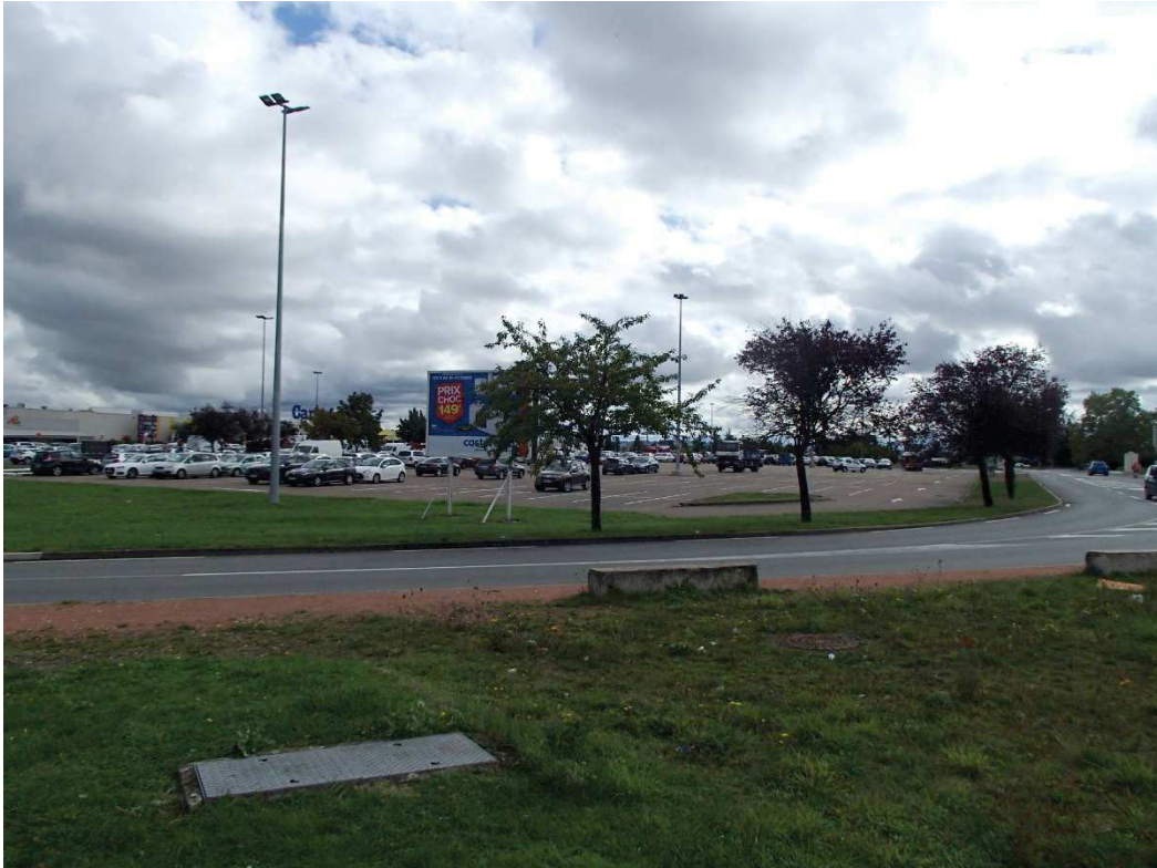
VUE N°5 : SITE DU NOUVEAU BATIMENT INTERSPORT DEPUIS LE SECTEUR OUEST