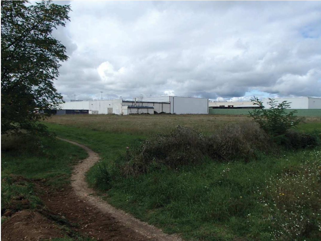
VUE N°1 : SITE DU PARKING POUR LE PERSONNEL DEPUIS SON ANGLE SUD-EST