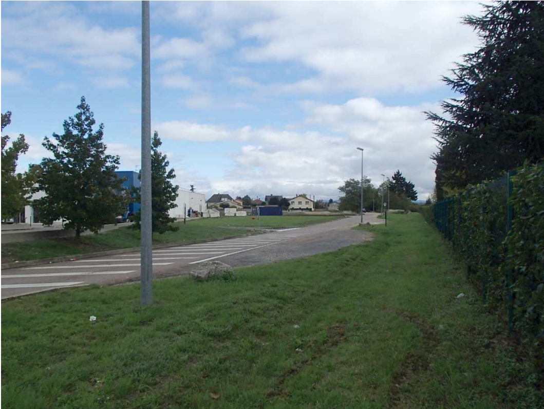
VUE N°3 : SITE DU PARKING POUR LE PERSONNEL EN VISION LOINTAINE DEPUIS LA SORTIE SUD DU CENTRE COMMERCIAL