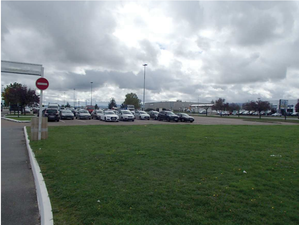
VUE N°7 : SITE DU NOUVEAU BATIMENT INTERSPORT DEPUIS LE SECTEUR NORD EST