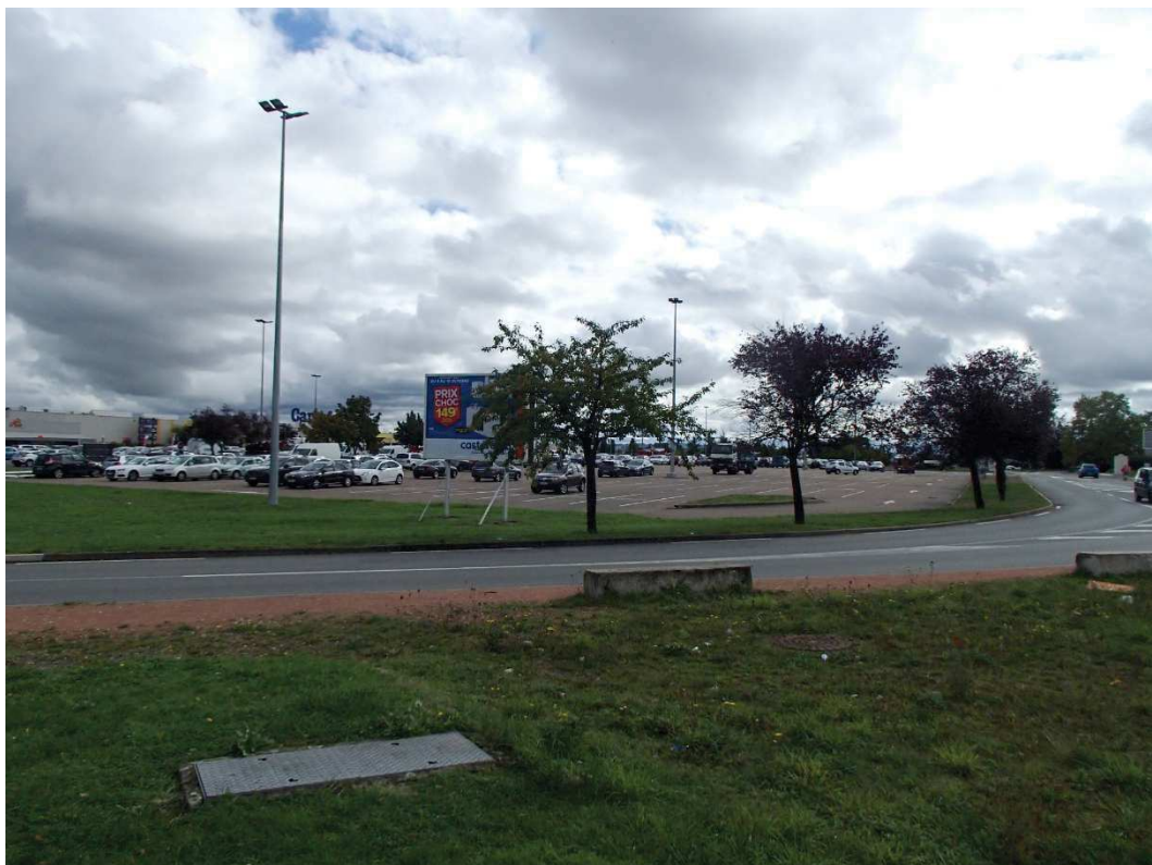
VUE N°4 : SITE DU NOUVEAU BATIMENT INTERSPORT DEPUIS LE SECTEUR NORD