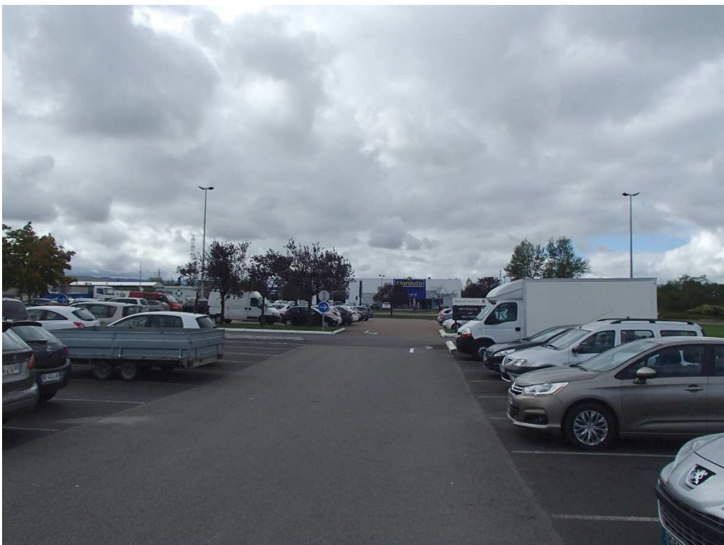
VUE N°6 : SITE DU NOUVEAU BATIMENT INTERSPORT DEPUIS LE SECTEUR EST