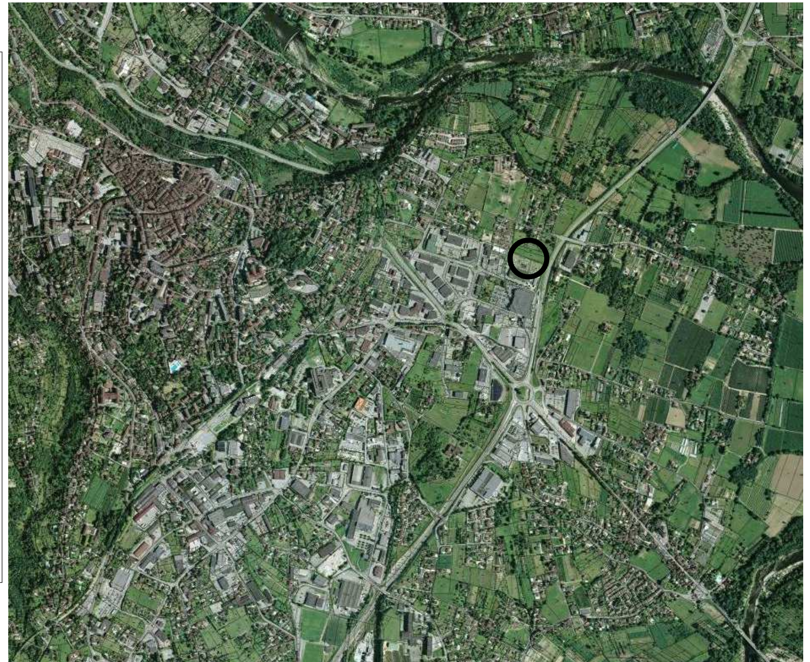
Plan de situation: application cadastrale 1/2000