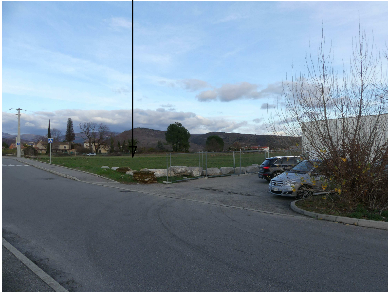
VUE 1 photo proche