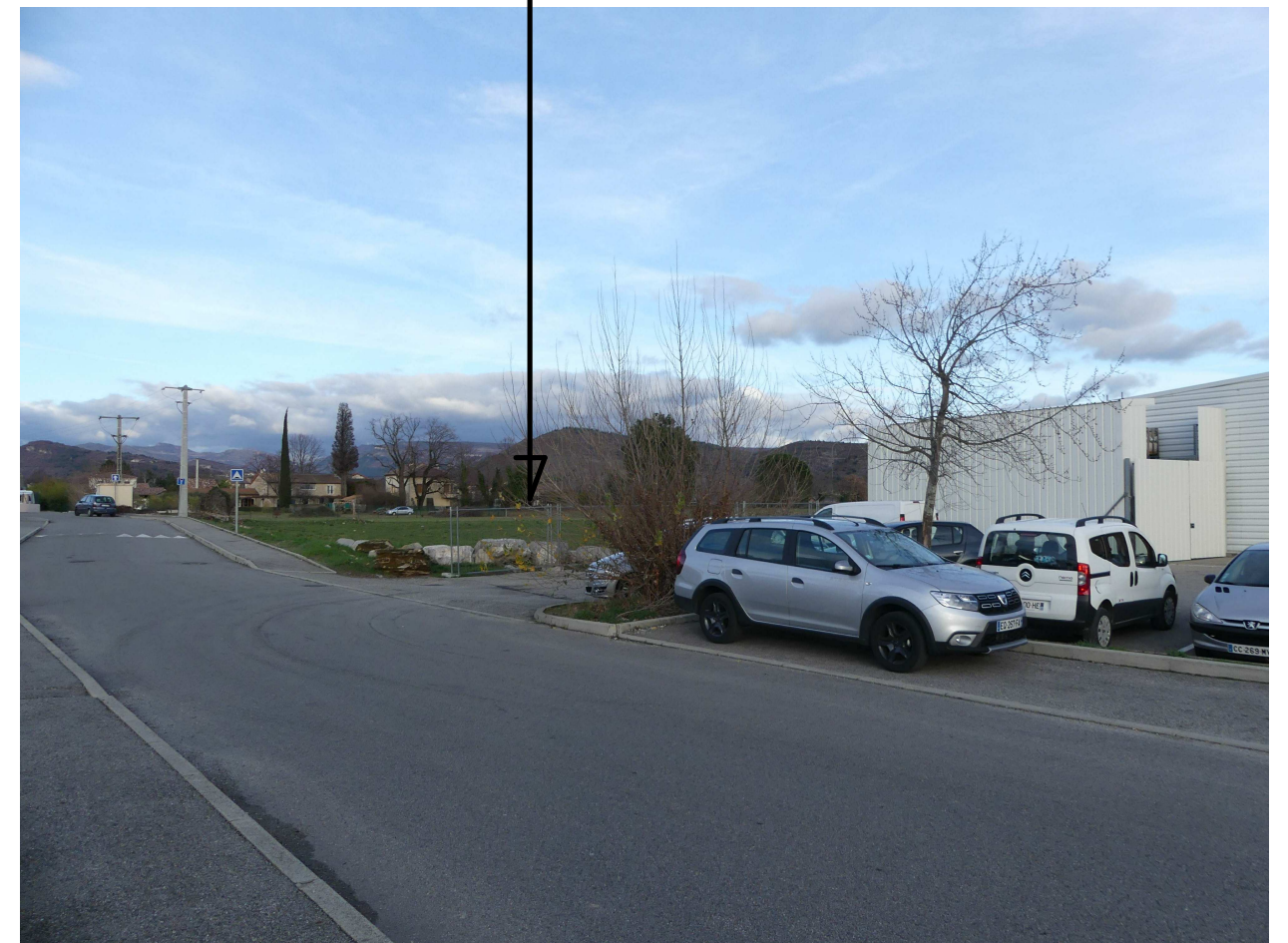
VUE 2 photo lointaine