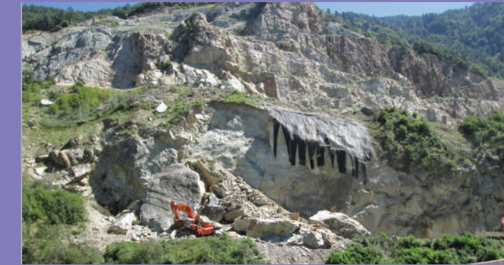
Préparation du site avant minage