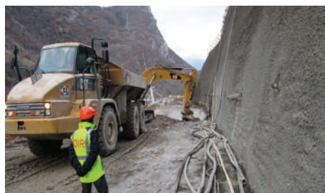
Mur de soutènement

C'est sans doute l'aspect le plus visible du chantier. Les travaux de terrassement se poursuivent. Deux des trois murs de soutènement longeant la future RN90 sont à ce jour quasiment terminés.