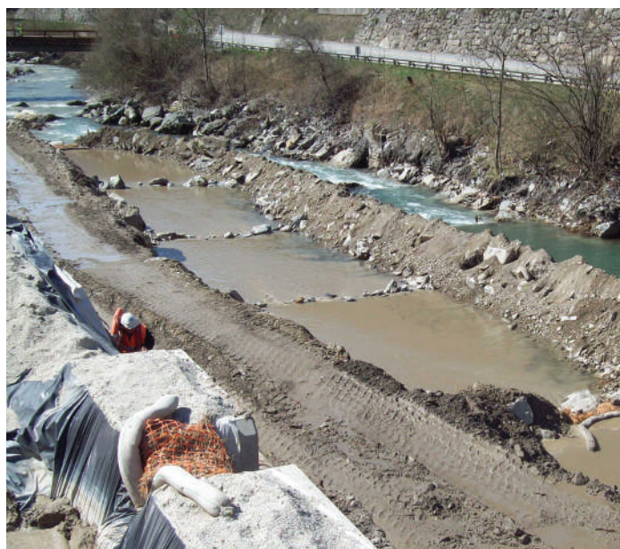
Bassins de décantation

■ Enfin, des pêches de sauvetage des espèces piscicoles ont été réalisées.