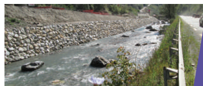
Enrochements en rive gauche

Les enrochements permettent de stabiliser la berge. Ils sont réalisés à sec, à l'abri d'un batardeau construit provisoirement au fur et à mesure des travaux dans l'Isère. Aujourd'hui 600 mètres d'enrochement sont totalement posés en rive gauche et les 500 mètres restants sont partiellement réalisés.