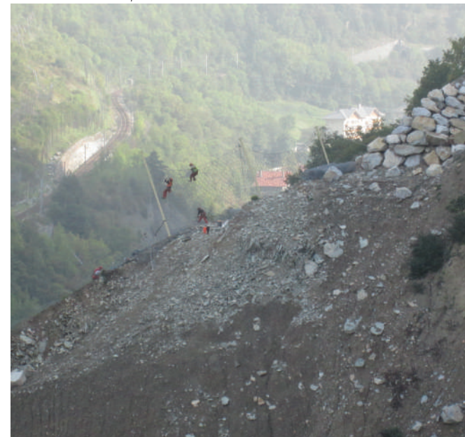
Installation d'un écran pare-bloc

Nous avons donc choisi de privilégier les merlons même si cela nécessite des travaux de terrassements importants. Pour compléter le dispositif comptant huit merlons, six écrans ont été installés et des zones potentiellement à risques ont été confortées à l'aide d'ancrage et de grillage.