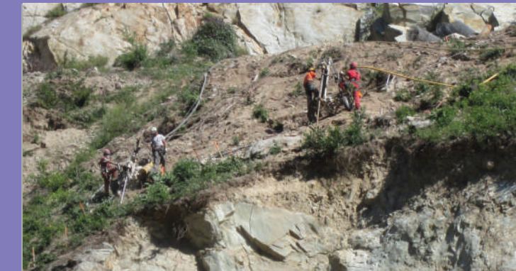
Forage en vue des tirs de mine