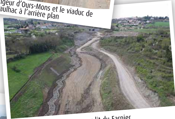
Le nouveau lit du Farnier