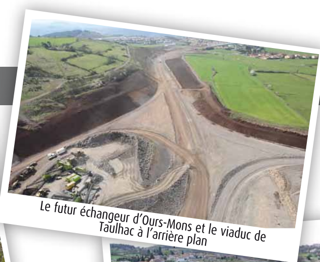
Le futur échangeur d'Ours-Mons et le viaduc de Taulhac à l'arrière plan