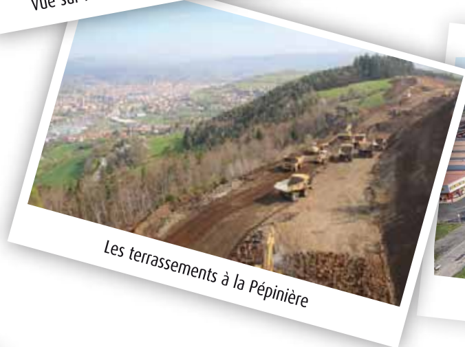
Les terrassements à la Pépinière