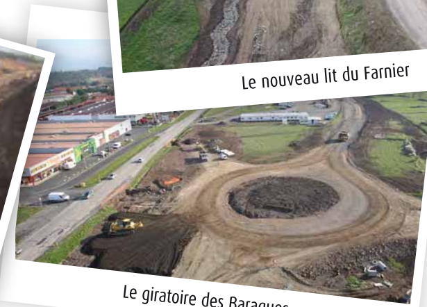
Le giratoire des Baraques