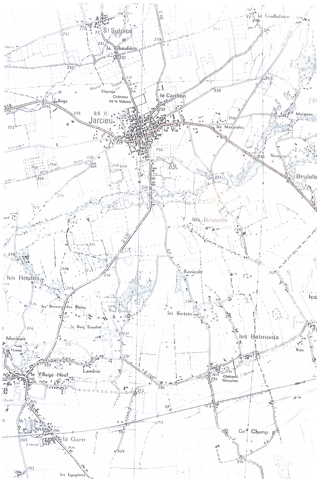
Plan de situation Echelle 1-25000