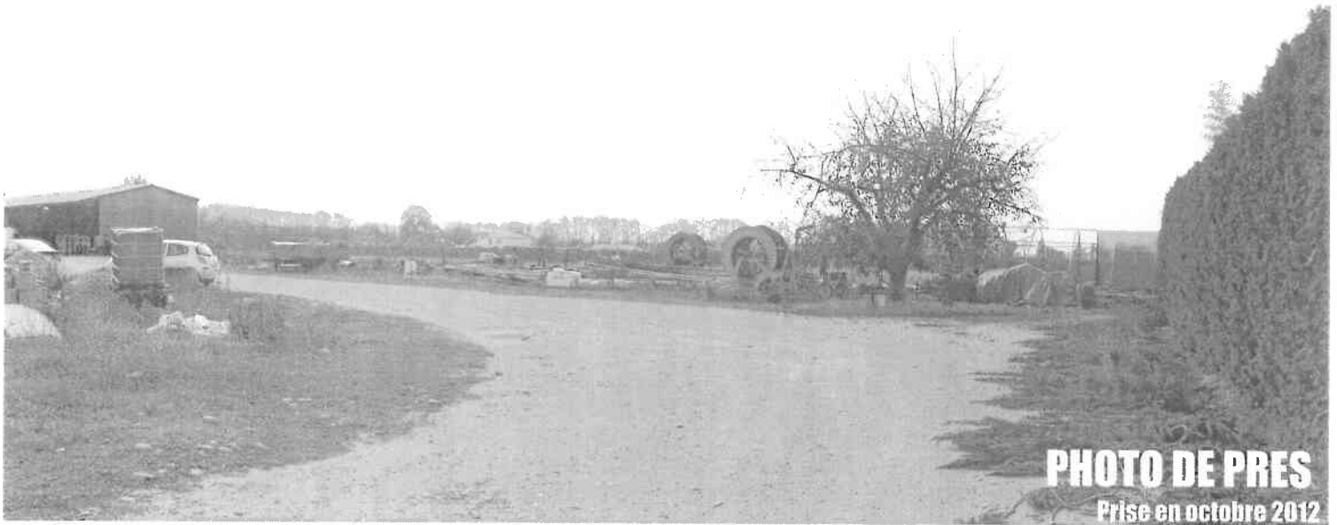
PHOTO DE PRES