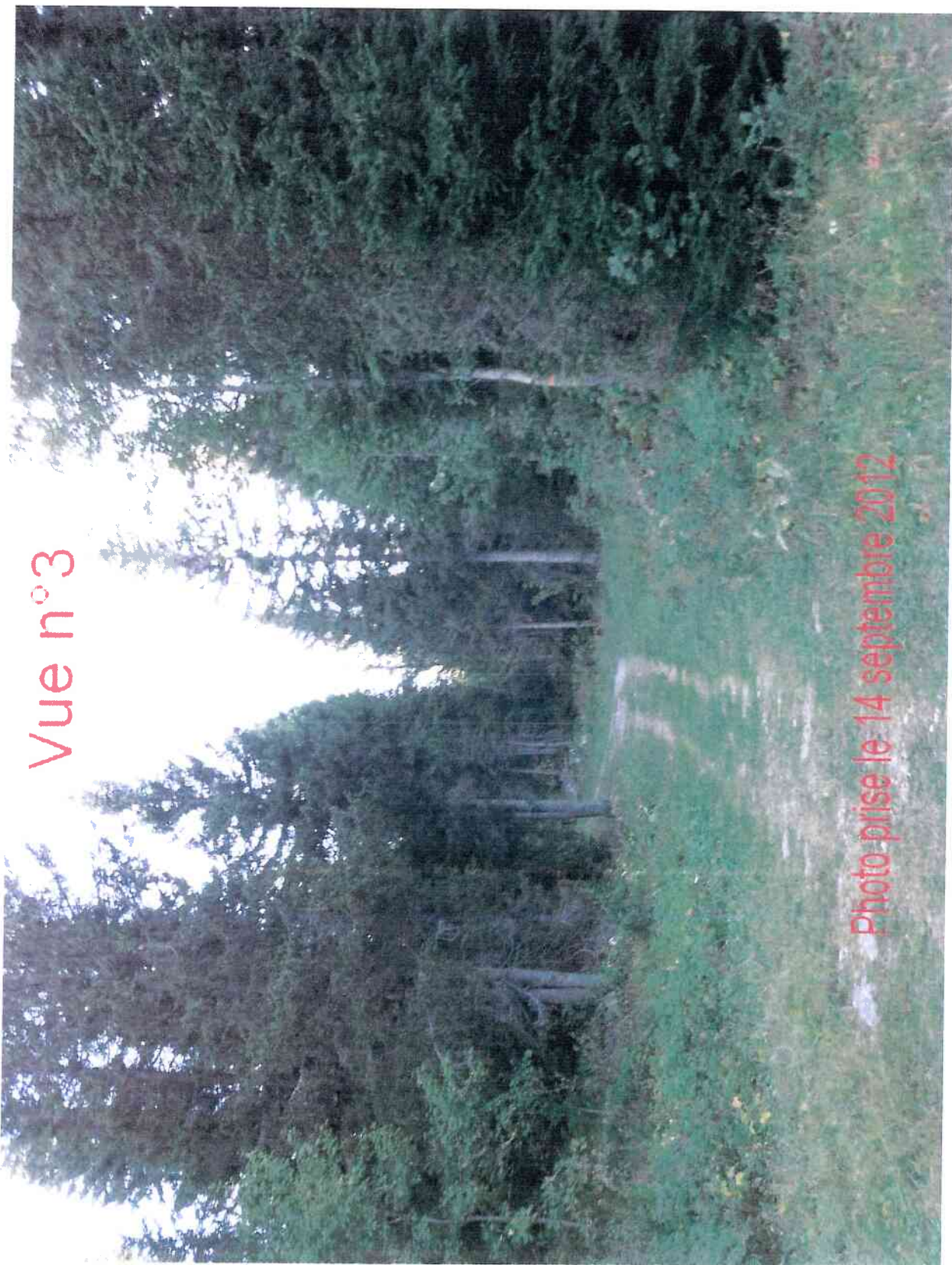
Photo prise le 14 septembre 2012