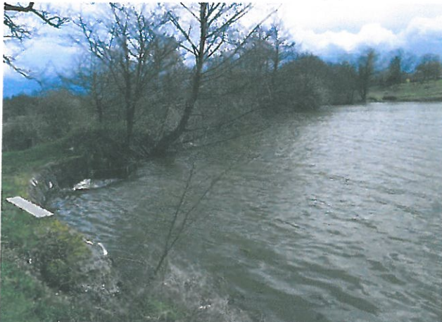
Fig. 5 : vue sur le déversoir de l'étang Picuze, CEN Allier – 12/04/2013