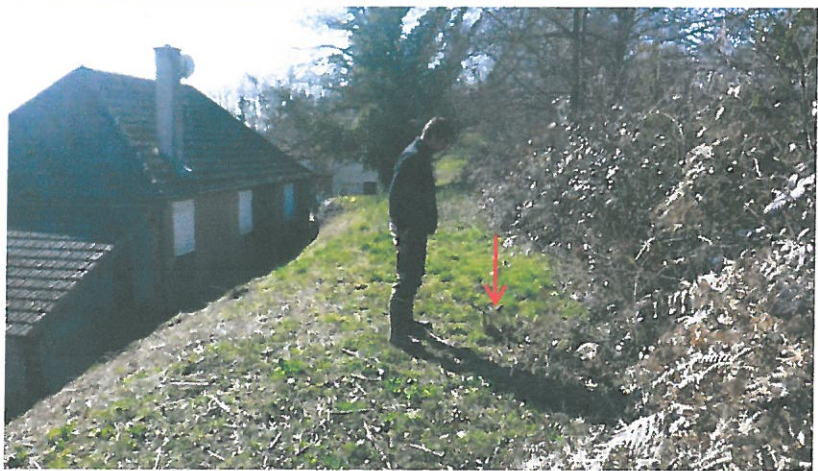
Fig. 11 : situation de la cheminée du terrier de Castor au sein de la digue d'étang, CEN Allier – 12/03/2015

La chambre semble se située plus vers l'intérieur de la digue, en direction de la maison.