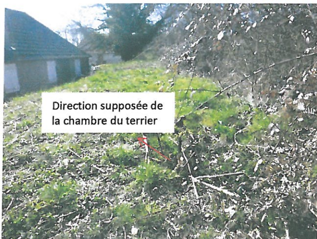
Fig. 12 : Description (photo) de la direction supposée de la chambre au sein du terrier de Castor, digue d'étang, CEN Allier – 12/03/2015