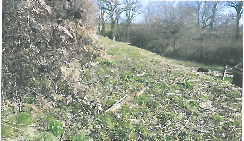
Fig. 10 : vue sur la cheminée du terrier de Castor d'Europe, digue de l'étang Picuze, CEN Allier – 12/03/2015

Par observation visuelle, il semble que la cheminée soit profonde d'au moins 60 cm.