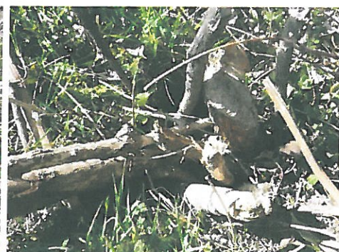
Fig. 8 et 9 : vue sur la cheminée d'un terrier de Castor d'Europe, digue de l'étang Picuze, CEN Allier, 12/03/2015