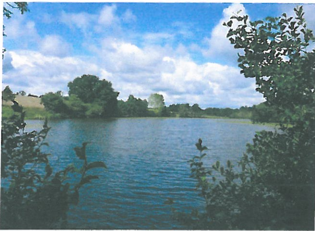
Fig. 3 : vue sur l'étang Picuze depuis la digue, CEN Allier – 08/07/2014