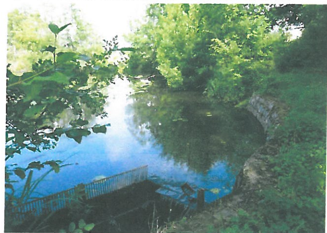
Fig. 6 : vue sur le déversoir de l'étang Picuze, CEN Allier – 08/07/2014