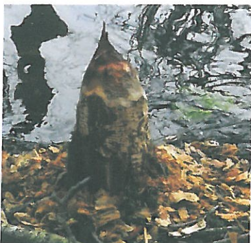
Fig. 7 : crayon de Castor d'Europe, étang Picuze, CEN Allier – avril 2014