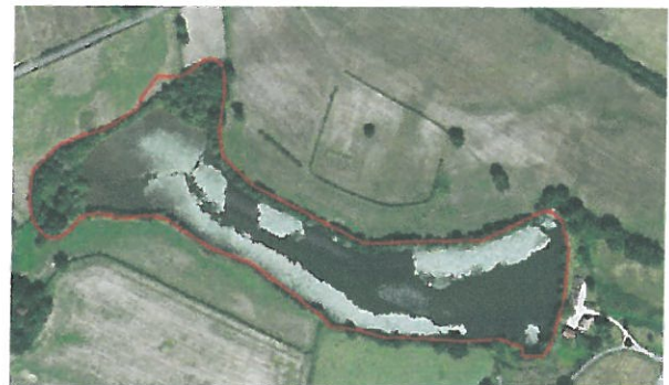
Fig. 2 : photographie aérienne (IGN - 2009) de l'étang Picuze