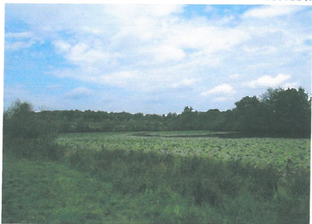
Fig. 4 : vue sur l'étang Picuze depuis la berge Est, CEN Allier – 23/07/2013