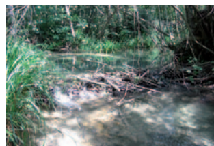
Castor d'Europe et son barrage

Des oiseaux : le Faucon hobereau et le Petit Gravelot, tous deux migrateurs, se reproduisent régulièrement sur le site. Le Martin-pêcheur d'Europe peut y être observé toute l'année.