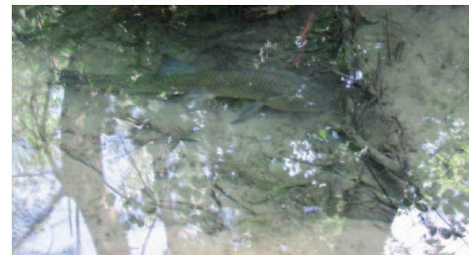
Chevaine dans la Freydière

Sur ce site, l'arrêté de biotope veille au maintien de l'intérêt écologique des milieux situés dans le lit de la Drôme, ainsi que des nombreuses espèces végétales et animales protégées au niveau national.