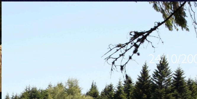
Saint-Agrève 24 octobre 2008