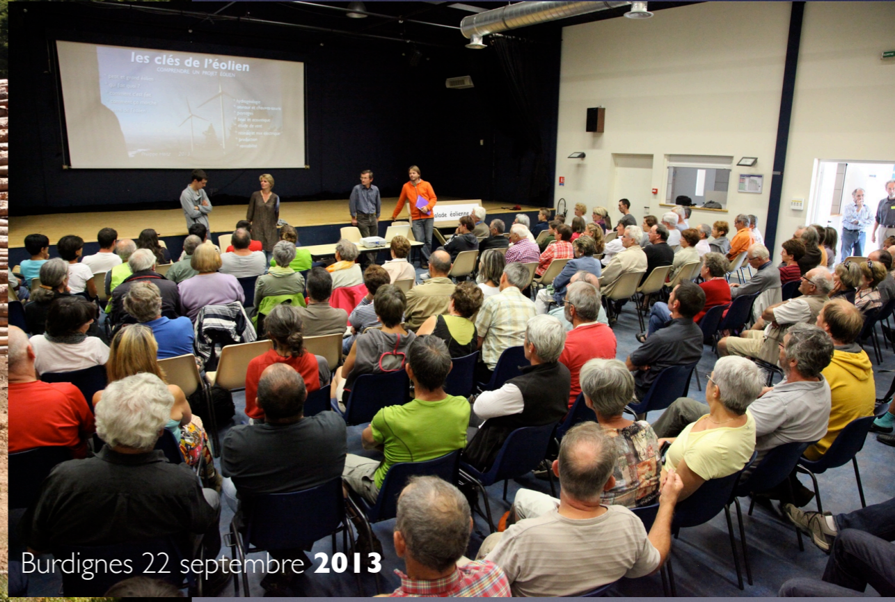
Burdignes 22 septembre 2013