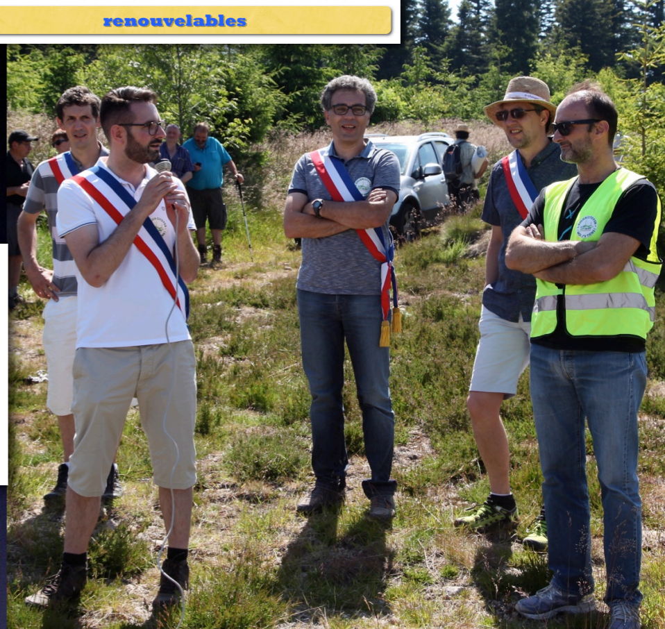
Saint-Sauveur-en-Rue 30 juin 2018