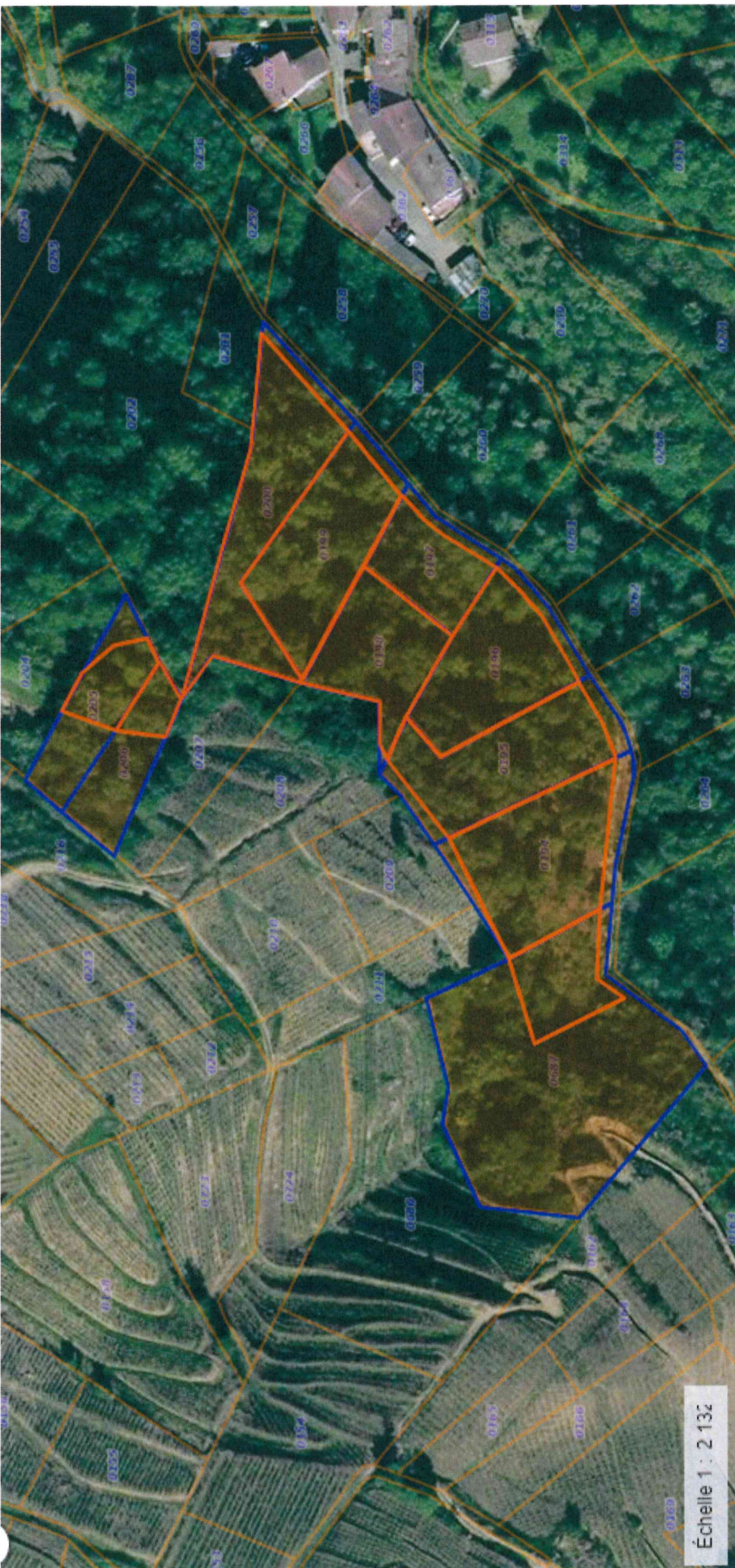
Annexe n°4 : Image aérienne du projet du 25/09/2020