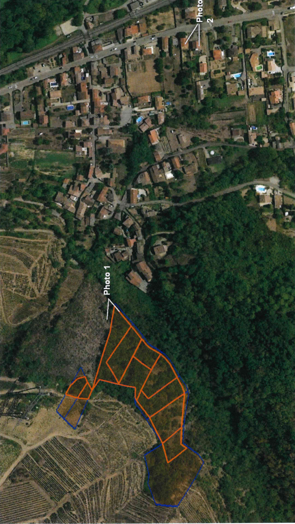
Annexe n°6 : Localisation des photographies du 28/09/2020