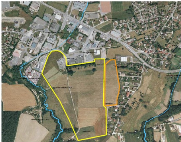
Carte 4 Localisation du projet