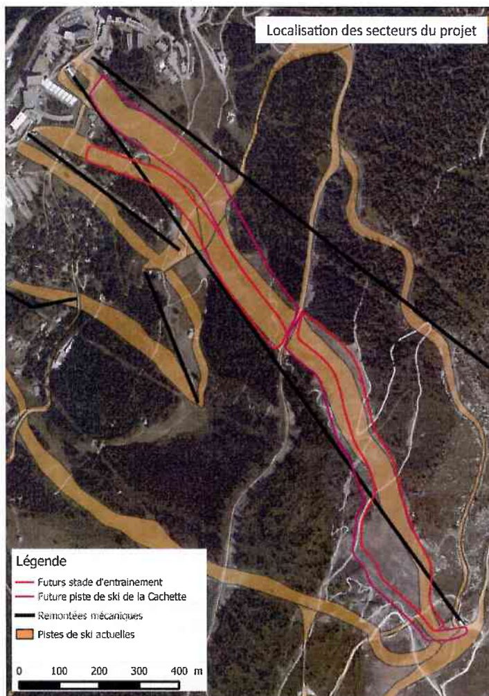
Localisation des différentes emprises des pistes d'entraînement et commerciales

Aucune piste d'accès ne sera créée pour la réalisation de ce chantier, le réseau de pistes existantes étant suffisant. Pour les secteurs non desservis par des pistes 4x4, seules les pelles araignée seront utilisées.