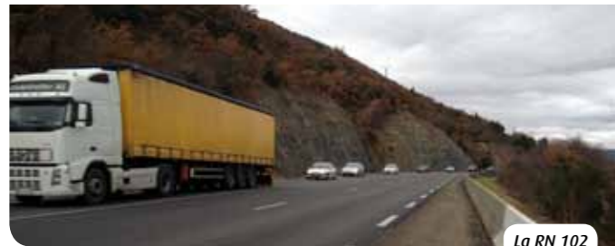
La RN 102

La RN102 est un axe structurant pour le département de l'Ardèche. Elle accueille le trafic de transit entre le massif central et la vallée du Rhône, les circulations touristiques à destination de l'Ardèche méridionale et les déplacements locaux en lien avec l'agglomération de Montélimar. Régulièrement engorgée, la RN102 génère d'importantes nuisances pour les riverains dans la traversée du Teil. C'est pourquoi l'État met aujourd'hui en œuvre, avec ses partenaires, le contournement du Teil. Un premier maillon a été mis en service en mai 2010 avec la déviation de la RD86 ; le présent projet permettra de boucler le contournement.