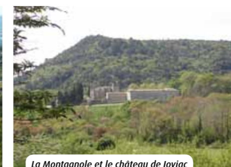
La Montagnole et le château de Joviac