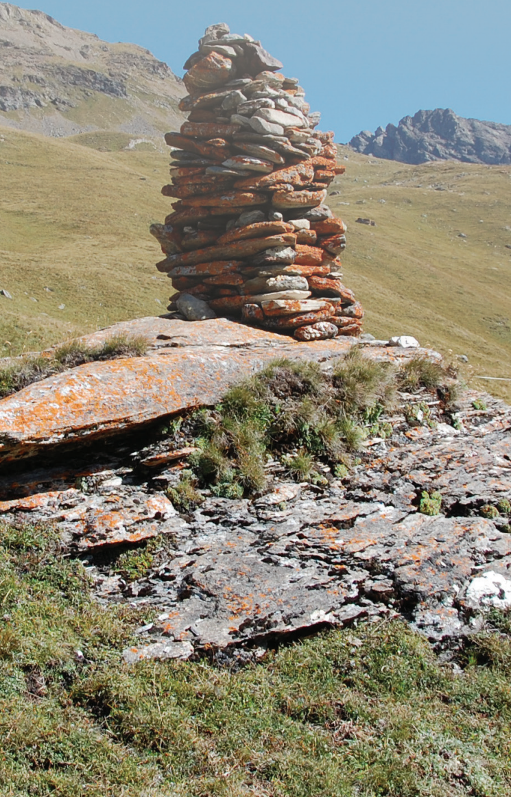
Cairn au dessus du Clou

Prolongement naturel du hameau du Monal, constituant la porte d'entrée du vallon du Clou, cet ensemble majestueux bénéficie d'une grande notoriété.