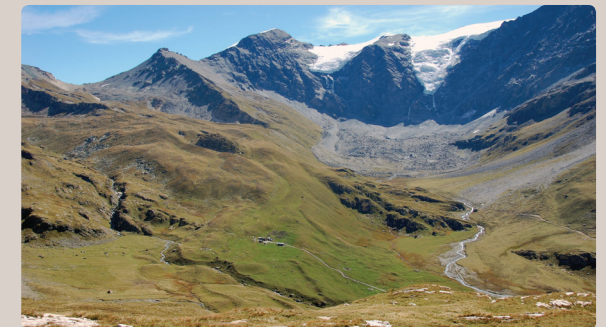
Glacier des Balmes et ses pointes

Tous les sommets portent ici le nom de "Pointe". Les plus hautes dessinent une frontière avec la vallée d'Aoste, en Italie. Prolongeant ce chapelet de pointes, le Rocher de Pierre d'Arbine, avec le massif des Monts à l'Ouest et les rochers de Pierre Pointe, achèvent la construction de ce magnifique vallon qui s'apprécie par son échelle et sa cohérence.