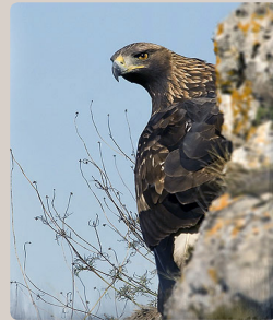
Aigle royal

Compris entre 1 850 m d'altitude pour le Monal et 3 567 m pour la Pointe des Plates des Chamois, ce territoire est peuplé d'une faune caractéristique des étages alpin et subalpin.