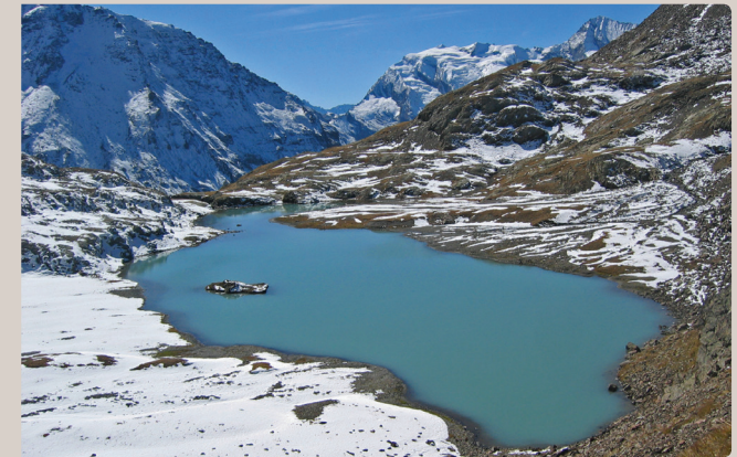
Lac Brulet

Les lacs révèlent quant à eux la présence de plusieurs espèces de poissons, certaines très rares en Savoie, en particulier dans les lacs Noir et le lac Verdet.