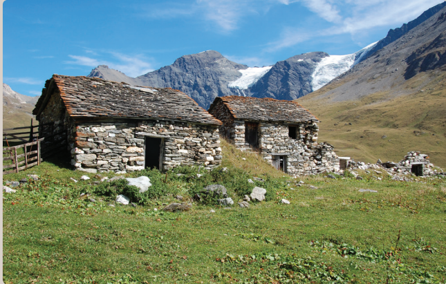
Vestiges des chalets d'alpage traditionnels

La majesté du glacier des Balmes et la présence des lacs marquent la qualité paysagère du vallon servant d'écrin au hameau du Monal, modèle de bâti traditionnel et remarquable de Savoie.