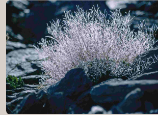
Arabette des alpes