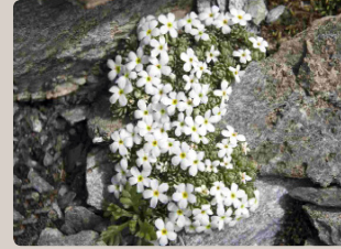
Androsace alpin

Les différents types de pelouses alpines dont la composition varie avec les versants, l'exposition, la nature du substratum géologique et les pratiques pastorales, cumulent une diversité floristique hors du commun. Plus d'une quinzaine d'espèces végétales sont protégées au niveau national.