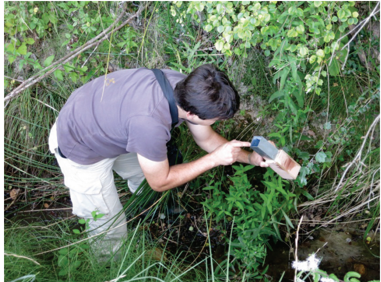
Etude du milieu naturel

Des levés topographiques ont également été effectués afin de recueillir les mesures permettant d'établir un projet tenant compte des spécificités du terrain.