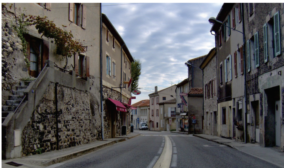
La RN102 dans la traversée du Teil

En reportant les poids-lourds sur le contournement du Teil, le projet permettra d' apaiser la circulation dans le centre-ville du Teil aux voies étroites et au caractère très urbain, et ainsi de renforcer la sécurité des personnes qui vivent et se déplacent dans l'agglomération.