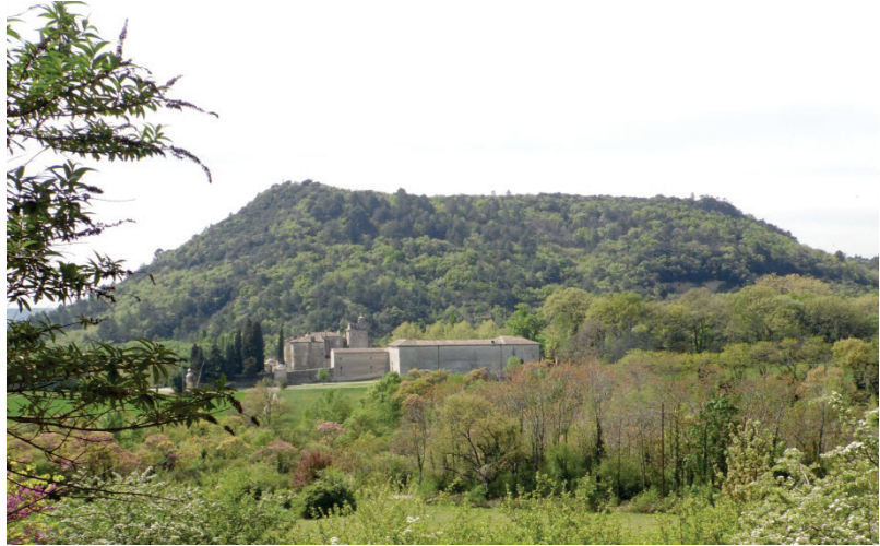
Le château de Joviac

Le tracé du futur contournement du Teil passe à proximité du château de Joviac , dont le système hydraulique est classé au titre des monuments historiques. Le projet doit permettre l'écoulement des eaux qui alimentent ce système hydraulique.