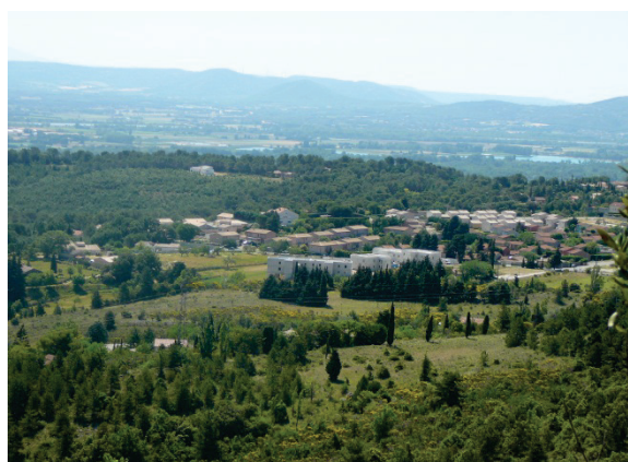
Plateau de la Sablière

La commune du Teil mène actuellement des études pour l' aménagement d'un point d'échanges au niveau du quartier de la Sablière .