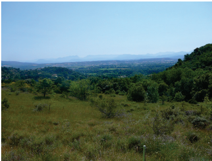
Paysage depuis le chemin de Mayour

Le projet de contournement du Teil s'inscrit dans un paysage de qualité . Afin de garantir une insertion optimale du projet dans son environnement, la maîtrise d'ouvrage a recruté une équipe de maîtrise d'œuvre aux compétences pluridisciplinaires, avec des techniciens, des architectes et des paysagistes.