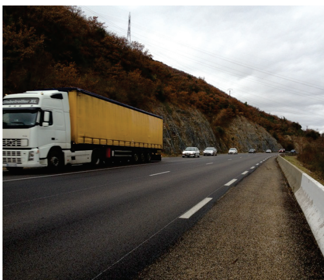
Circulation de poids-lourds sur la RN102

La RN102 est fortement empruntée par les poids-lourds qui circulent entre le Massif central et la vallée du Rhône.