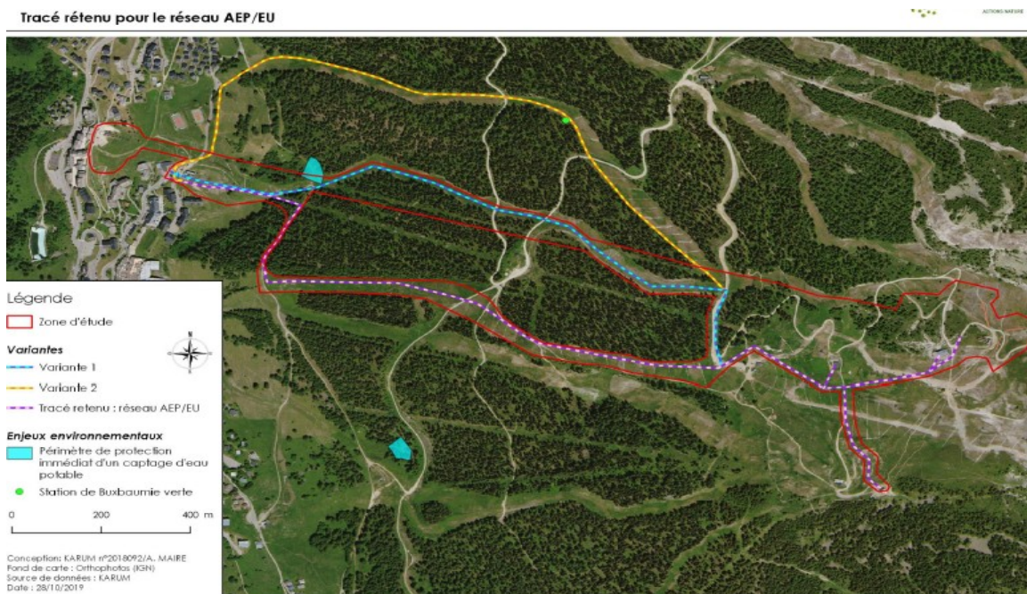
Illustration 5 : variantes examinées pour le réseau eau potable et eaux usées (source : étude d'impact page 196)

Une cartographie de synthèse permet de visualiser le positionnement des options examinées.