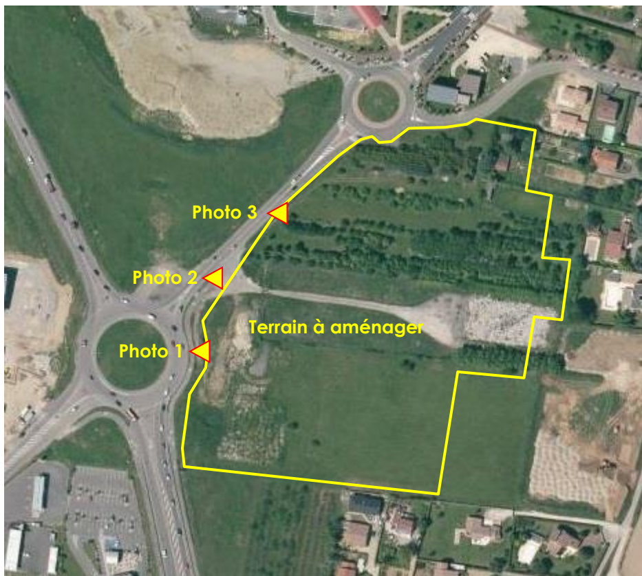
Plan de localisation des photos