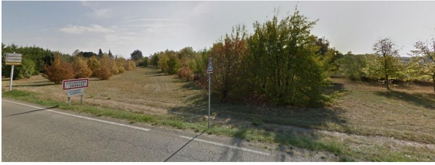
Photo 3 : vue de la partie nord du terrain depuis l'avenue Sadi Carnot (ancienne pépinière) (octobre 2017)