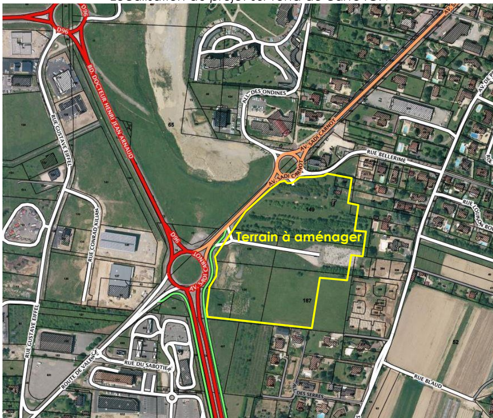
Localisation du projet sur vue aérienne au 1/5 000 ème (date de la prise de vue : juin 2013)