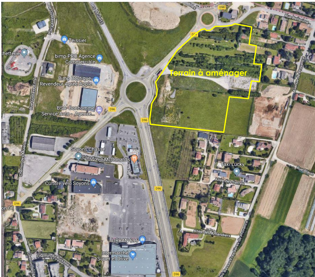
Vue aérienne localisant les principales activités commerciales présentes autour du terrain à lotir