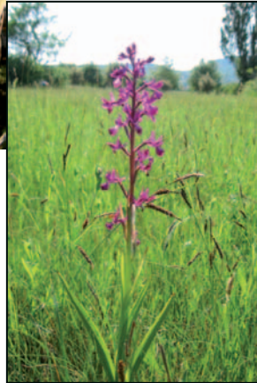
Orchis à fleurs lâches